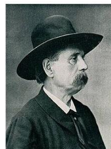
Le Temps des cerises